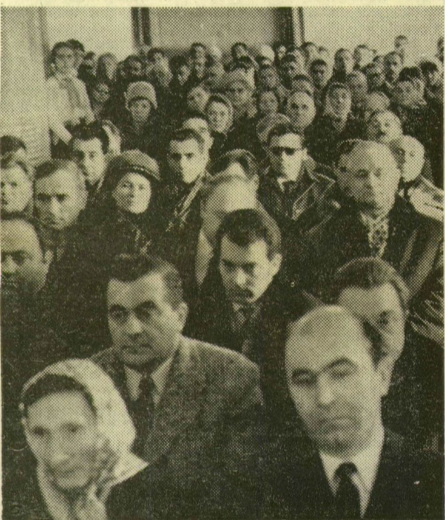
Az ünnepség résztvevőinek egy csoportja