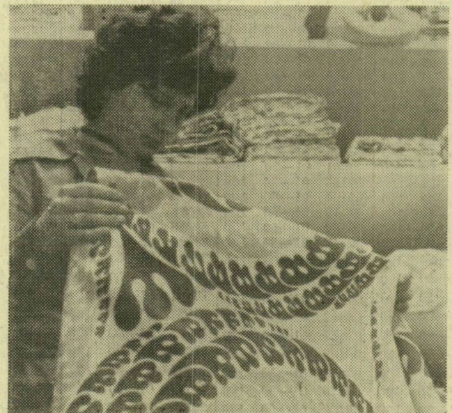
Tíz szövőgépet helyettesít a Malimó berendezés, melyen a gyár egyik új terméke, a varrva hurkolt, nyomott színes dekorációs szövet is készül

A vállalat gyártmányfejlesztési osztálya több új terméket konstruált a következő esztendőre. Általában az jellemző a gyártmányfejlesztésre, hogy hagyományos nyersanyagokkal keverik a műanyagot, elsősorban a polipropilént. Lisztesszákokat, hagymásszákokat készítenek kevert nyersanyagból. A megszórt szövetekből a jutarugyárban konfekcionálnak négy-öt féle zsákokat is, köztük a postának pénzeszákokat, valamint afrikai országoknak vizeszsákokat, amelyeket a tevék nyakába akasztanak a hosszú sivatagi utakra.