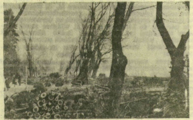
Az öreg partmenti fák már nem tudtak ellenállni a viharoknak. Derékba törtek korhadó törzseik, s bármilyen tájékozott is, de azokat ki kell vágni