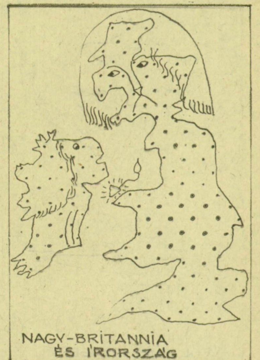
NAGY-BRITANNIA ÉS ÍRORSZÁG