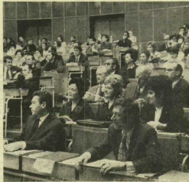
A tudományos ülés résztvevőinek egy csoportja

ágykihasználási százalék 50-ről 94,4 százalékra ugrott, ami egyetemi intézetben meglehetősen mostoha arány, hiszen szinte egymás helyére fekszenek a betegek.