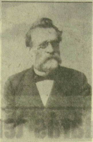
Lechner Lajos, Szeged újjáépítője 75 évvel ezelőit hunyt el. Ma, szombaton délből Szeged megyei város tanácsa, a Műszaki és Természettudományi Egyesületek Szövetségének Csongrád megyei szervezete és a Magyar Építőművészek Szövetsége emléktábla avatásával emlékezik meg a kiváló mérnök munkásságáról.

Munkásságának legmaradandóbb értéke az elpusztult Szeged újjáépítési terve. A külön bizottsággal 1879 júniusában érkezett a városba, és októberre már kész terveket mutatott be, amelyekben bölcs előrelátással évtizedekre előre számolt a város fejlődésével. Az elfogadott és megvalósított terv hat részfeladattal megoldásra épült. Kidolgozta a város területének a későbbi árvizekkel szembeni védelmét. A várost kör- és sugárutakra építette. Megalkotta azokat a változtatásokat, amelyek a kereske-