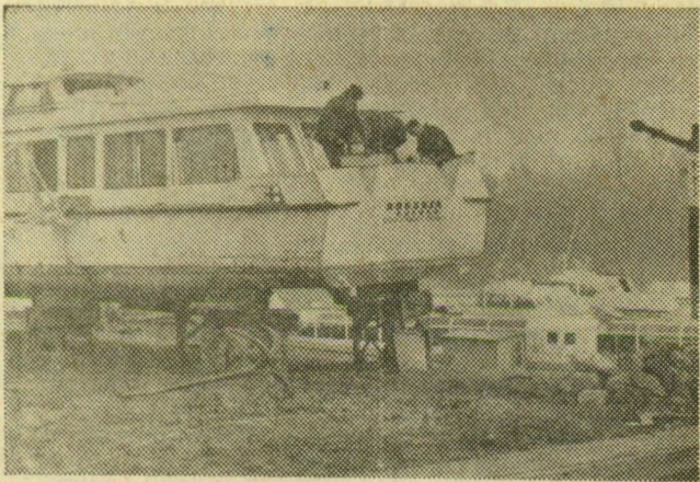
Az Odessza kishajó a két part között szállította a strandolókat. Most a motorját generálózák.

A tápéi hajójavítóban megszaporozott a munka. A téli hónapokban több hajóvontató, uszály és vízbusz pihen a partmenti vizeken. Javításra, felújításra, karbantartásra várnak. A Vízmuvek és Fürdők kishajója, az Odessza is a javítóba került. Nemrég emelték partra és hamarosan felújítják a motorját, a Dunán dolgozó Váshelyi Pál vontatót pedig vízre bocsátották.