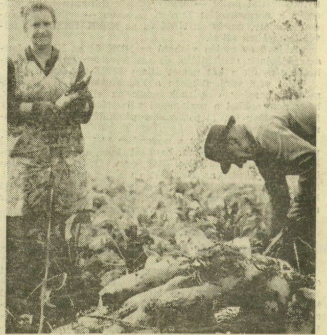
Vidékünkön bőkezű az idei ős, van mit betakarítani a földekről. Kibekháznál a répaszedés van hátra, szorgalmas kezek dolgoznak itt is. Kiváló föld a kübeki határ, de ekkora takarmányrétüket ritkán terem