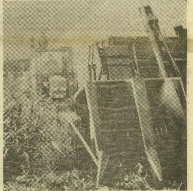
Nyole esőtörő 35 holdról 16 vagon kukoricát tör le naponta Szőreg határában. Jó szervezés a titka, hogy megállás nélkül dolgozhat valamennyi. Négyezerötven vagonra számítanak összesen, 200 hold várja még a gépeket; dolgoznak is nyújtott műszakban

Falburkoló csempéből majdnem háromszor annyit készült, mint egy évvel ezelőtt. A mozaik-cement lapból a 20 ezer, húzott síkúvegéből pedig a 30 ezer négyzetmétert is meghaladja a termelési többlet. A kő- és kavicsbányák, valamint a betonelem-gyártó üzemek sok értékesítési nehézséggel küszködtek, s általában visszaesett a termelés. Továbbra is sokan vásároltak azonban feszített- és lágyvasas betongerendákat, s így ezekből a termékekből mintegy 25 százalékkal a termelést növelhették. (MTI)