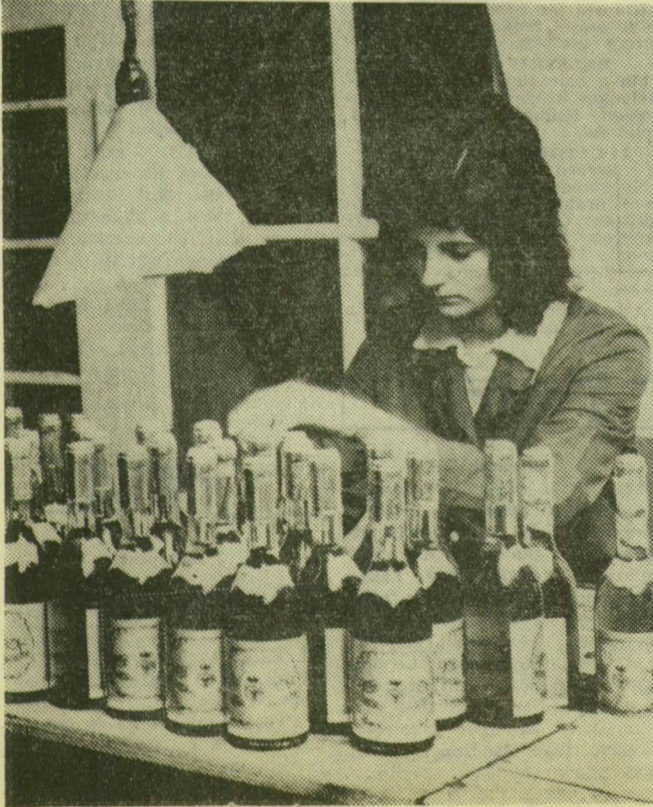
A Tokajhegyaljai Állami Gazdaság borkombinátjának mádi palackozójából évente 6 millió palack bor kerül a piacra