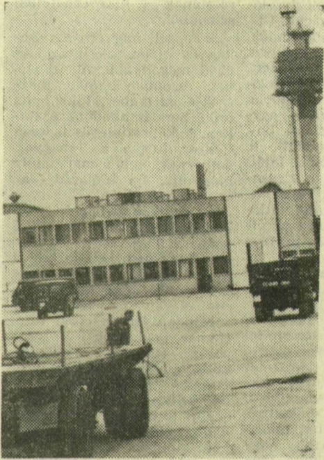
A központi ipartelepen először a szállítási üzemegység kapott helyet. Képünk a parkoló részletét, s mögötte az irodát mutatja be