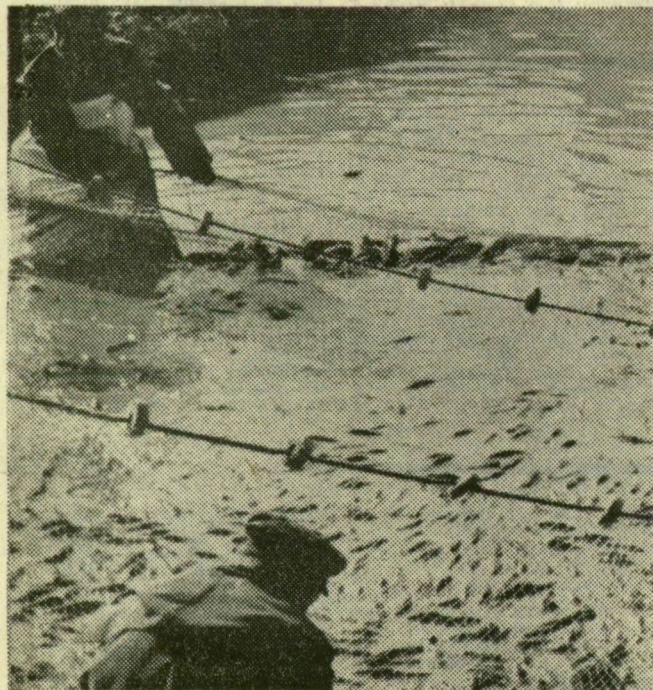
Két brigád halásza napról napra Fehértót. Akik a sándorfalvi oldalon húzzák a hálót, kétszáz tíz mázsát fognak naponta