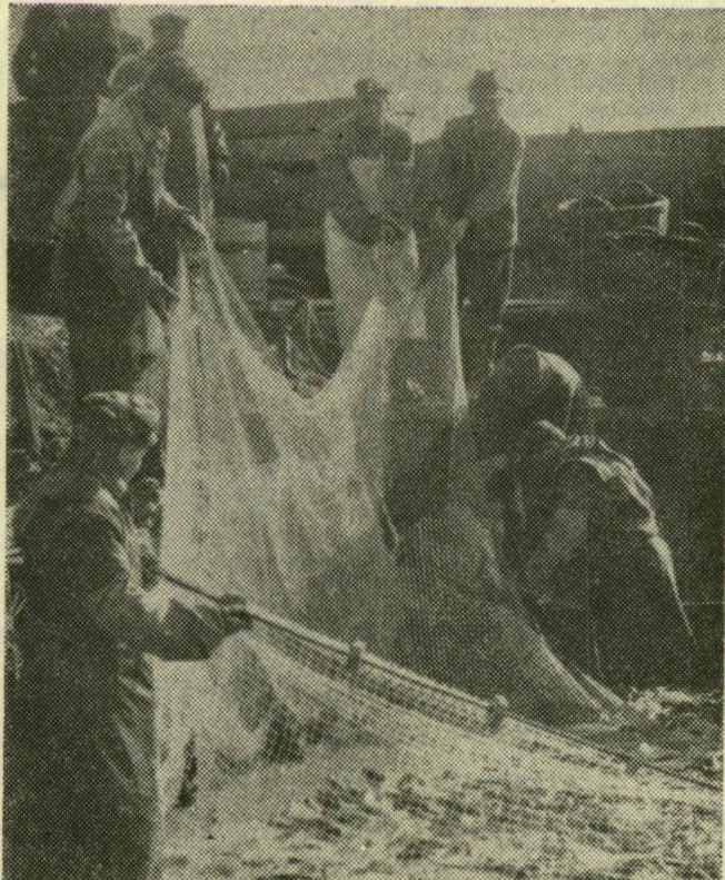
Ponty, növényevő amúr, pettyes busa, fehér busa nyűszög a hálóban, de mindig akad halászcárdák kedvelt esemegéjéből, a harcából is