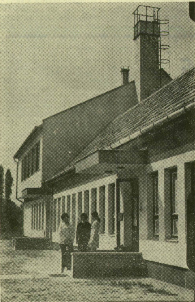
Hosszú évekig rakosgatták a pénzt Szatymazon a községfejlesztési alapba, mire új egészségház lett belőle. Elkészült az épület, külsőre is díszes lett az egyre épülő, szépülő falu új negyedének. Hogy mennyire szükség van rá, most tűnik ki igazán: a körzeti orvosi, a fogorvosi rendelő, az anya- és csecsemővédelmi tanácsadás rögtön falai közé költözött, meg sem várva, amíg a hozzá tartozó gyógyszerterület is berendezik. Képzünkön: az új rendelő a falu új negyedében