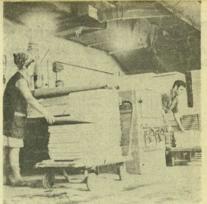
A Lenin körüli üzemben csiszológéppel munkálják a méretre vágott elemek felületeit