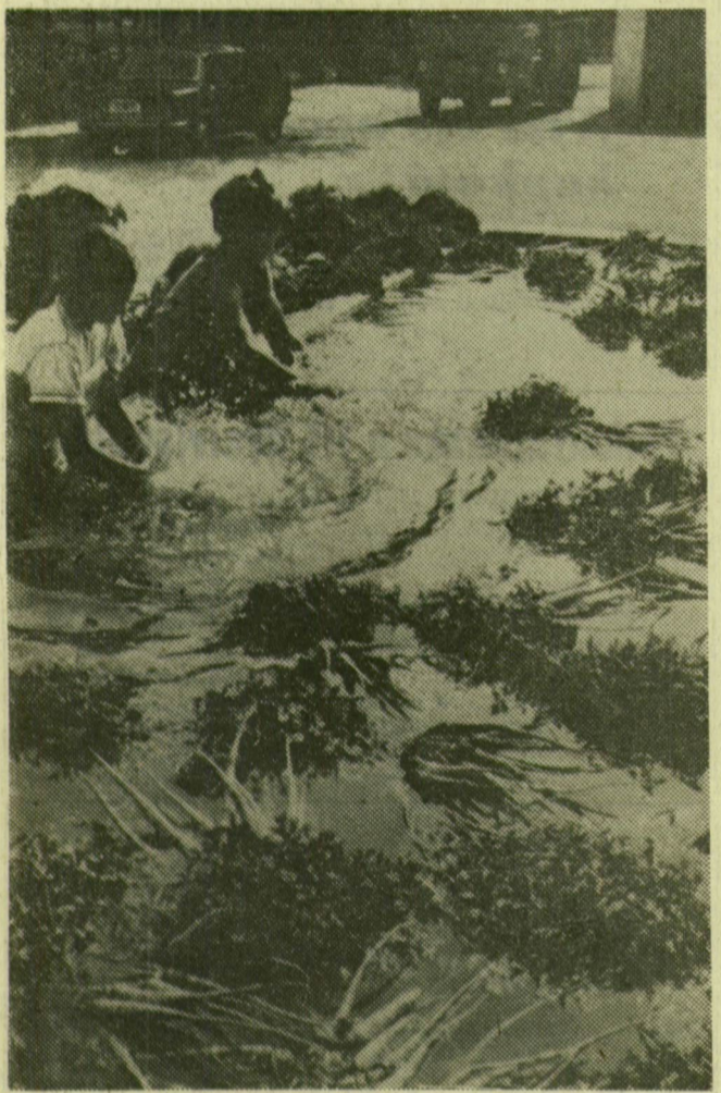
ZÖLDSÉGTERMELŐ NAGYÜZEM. Budapesten, a XVIII. kerületi Szabadság Tsz évente 10 millió forint értékű saját termesztésű zöldséget és gyümölcsöt szállít a piacokra. Képünkön: a zöldségféléket tisztára mosva jutatták a vásárlókhöz.