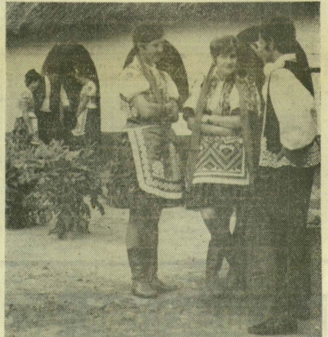
BUZSÁKI VASÁRNAP. Nagyobb ünnepeken és vasárnap a buzásziak még ma is a régi hagyományoknak megfelelő, színpompás népviseletbe öltöznek.

Az Egyesült Nemzetek Élelmezési és Mezőgazdasági Szervezetének (FAO) Münchenben rendezett regionális értekezletén lezajlott vitában nyilvánvalóvá vált, hogy a nyugat-európai marhahüshéllátás még hosszú éveket nem lesz megfelelő. A FAO adatai szerint a kelet-európai államok (Szovjetuniót nem véve tekintetbe) 1980-ig a nyugat-európai marhahüshéllátásnak csupán 15—30 százalékát fedezhetik, s emiatt tengerentúli behozatalra lesz majd szükség.