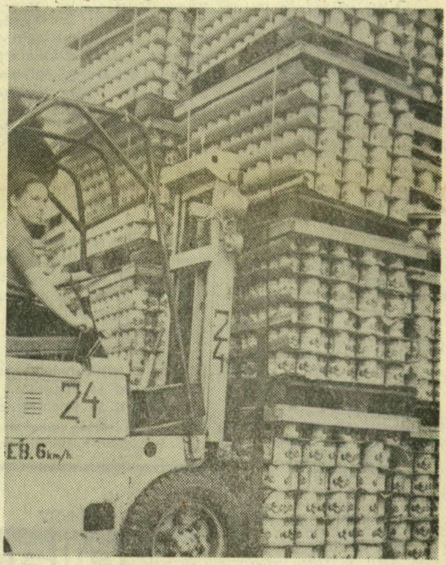
Az idén első ízben az NDK számára hámozatlan paradicsomot konzerválnak. Képeink a szállításra előkészített termékről készült