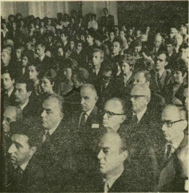
A tanévnyitó résztvevőinek egy csoportja

Az eredményjelző táblán megjelent: Aoky. Montreal. Befejeződött a XX. Nyári Olimpia.