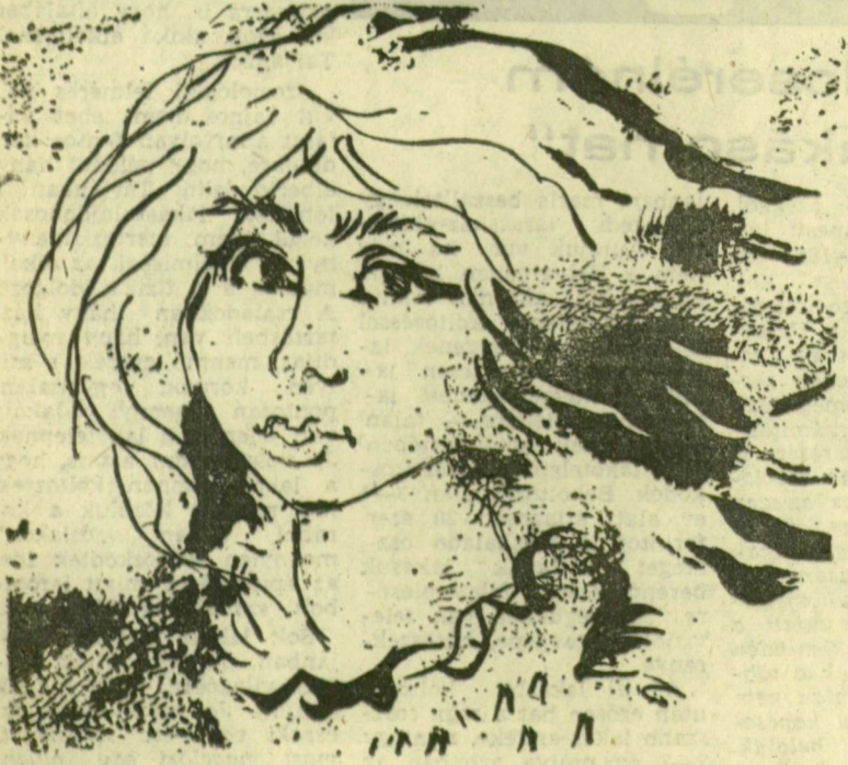
Kiss Attila rajza