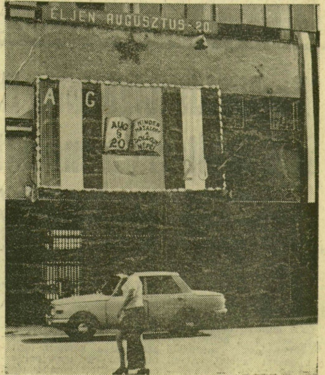
A szegedi szalámigyár homlokzatát már pénteken délutánra szépen földszíttették

Augusztus 20-ra, alkotmányunk ünnepére ünnepi díszbe öltözik Szeged. A középületeken, továbbá a vállalatok, gyárak, intézmények, házak homlokzatán feliratokkal, nemzeti színű és vörös zászlókkal is tisztelgünk alkotmányunknak. Az elmúlt napokban serény munkával készültek a transzparensek, amelyek a munkás-paraszt szövetséget is szimbolizálják. Tegnapra, péntekre általában mindenütt elkészültek az ünnepi dekorációk. Ezekről adunk képes mozaikot.