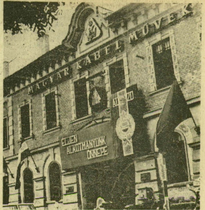
Zászlók, feliratok a kábelgyár főbejáratánál