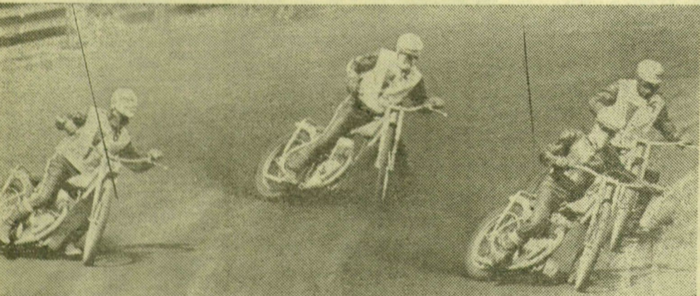
Képünkön egy korábbi verseny izgalmas küzdelme látható

A technikai sportágak viszik a pálmát az idei szabadtéri sportprogramban. Ez érthető is, hiszen a legnagyobb tömegeket érdeklő sportágak versenyzői mérkőzések tudásukat ebben az időszakban Szegeden. A záróverseny egyik legizgalma-