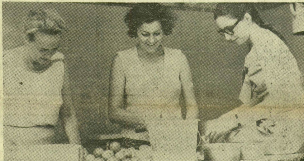
Az asszonyok már a főzőhelyen készítik el a meleg ételt