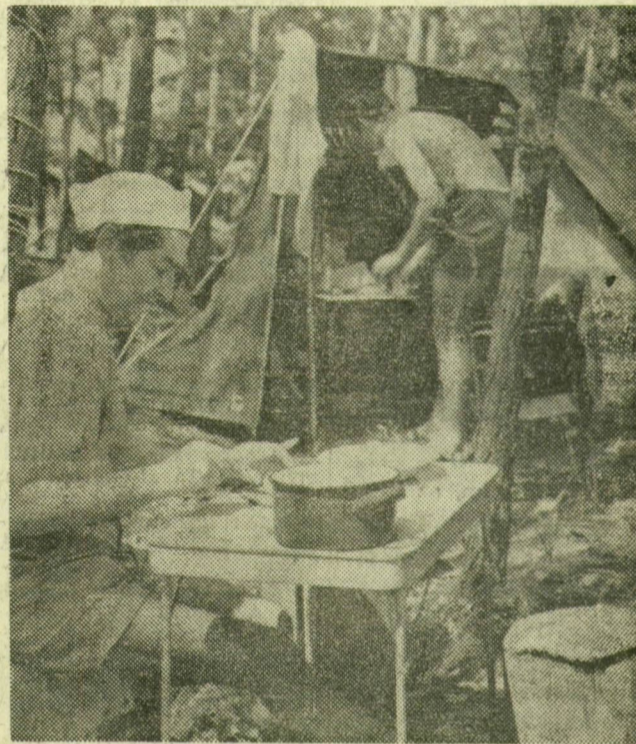
A táborigényesek a férfiak számára is kötelező krumplipucolást jelent

Az Izabella-hídról még nem sokat látni belőle, csak tábla jelzi az irányt, merre kell fordulnia a fáradt autósoknak, motorosoknak, hogy hosszú útja után megpihessen. Fialat fák között, szépen parkosított területen találjuk a Szeged Városi Idegenforgalmi Hivatal első osztályú nemzetközi kempingjét, mely néhány hónap óta működik csak, de a vendégek könyvében máris sok dicsérettel bejegyzés tanúsítja, hogy jól érzi itt magát a sok kül- és belföldi vendég. Látogatásunk idején a turisták 82 százaléka külföldi, sokan jönnek a szomszédos országokból, de távolabbi vidékek vándorai is sorra idetalálnak.