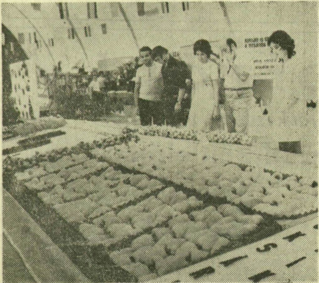
A kiállítás első látogatói