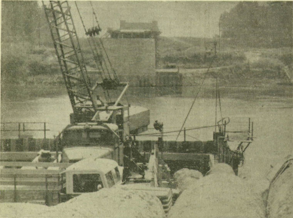
A jobb parti, már kész mederpillérrel szemben gyorsan épül a bal parti pillér is. Képzünk a betonozási munkáról készült.

A napokban történt tragikus baleset megfontoltságra, a biztonsági előírások megtartására ösztönzi az algyői híd építőt. A munka üteme ezzel azonban nem lassul. A 153 millió forintot be- ruházással készülő, s nagyon várt híd földmunkáinak 90 százalékát elvégezték, a bal parton két pillér áll, a jobb parton pedig teljesen elkészültek a pillérek, a Ganz gyár szakemberei már a szerelőállványt is összeállították.