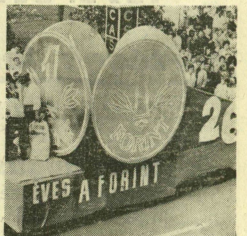
Somogyi Károlyné felvétele A 26 éves forint köszöntése