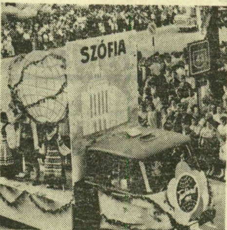
Bolgár népviseletbe öltözött fiatalok