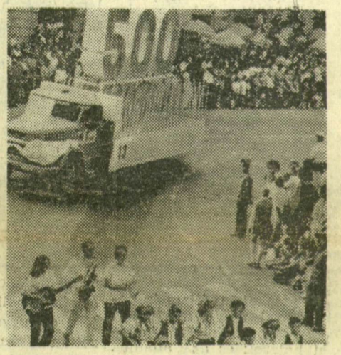
Tisztelgés Dózsa emlékének