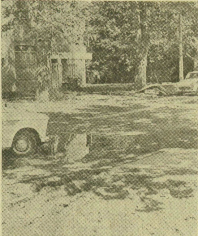
Sártenger az új kollégiumok környékén. Újszeged vendégeket váró s fogadó központjában

Pálné (Mórahalom, Szegedi u. 1.). Rovatunkban hírdetésekkal nem foglalkozunk. Márpedig az, hogy Ön magányos öregségében egy idős nő mellé szegődne gondozónak, inkább hirdetésfelvétel irodánkra tartozik. Ennek címe: Magyar Tanácsköztársaság útja 10.