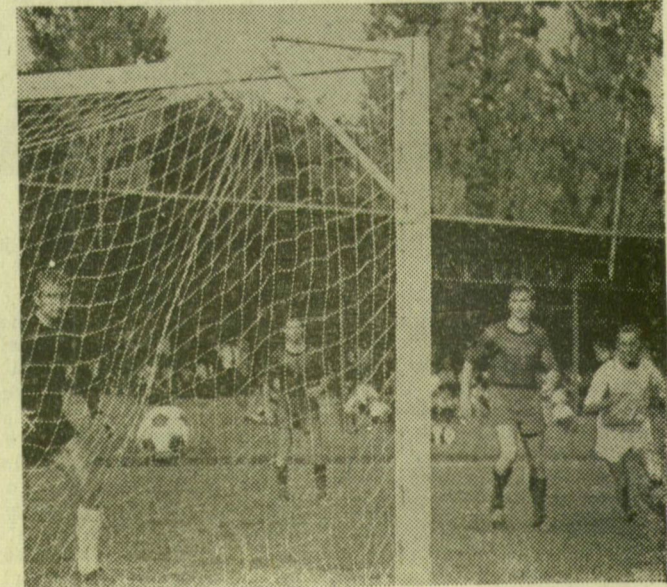
A befejezés előtt hét perccel Bíró (a képen nem látható) fejésgóllal kiegyenlít

1. Kossuth KFSE 3 2 - 1 8 - 4 8 2. Sz. Dózsa 3 1 1 1 3 - 2 3 3. Vác 3 1 1 1 4 - 4 3 4. Kiskunfélegyháza 3 1 - 2 4 - 9 2