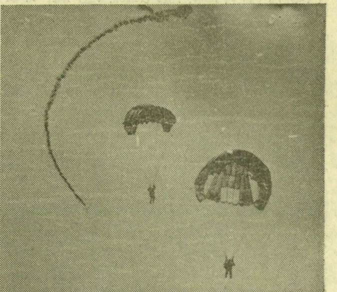
Ejtőernyősök, még messze a földtől