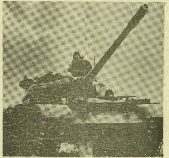
Egy, a gyakorlaton részt vevő harckocsik közül

— Örülök, hogy ilyen sokan jöttek el és kaphattak izelítőt néphadseregünk felkészültségéről, az MHSZ-ben folyó honvédelmi előképzésről. A részt vevő tízezrek azt is jelzik, hogy a dolgozó embereket érdekli néphadseregünk élete, technikai ellátottsága. A bemutatók a katonai tudást, az MHSZ-ben folyó hozzáértő tevékenységet bizonyították. Jó ezt időnként a széles nyilvánosság elé tárni. Tapasztalat az is, hogy a mostaninál még gazdagabb programmal érdemes időnként Szegeden honvédelmi repülőnapot tartani.