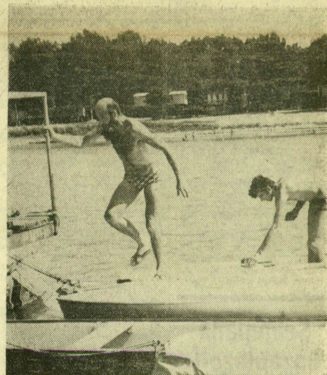
A hajót mázolni is kell. Úgy tűnik, elfogyott a festék

A nagykereskedelmi vállalat megyei lerakatai már júniusban megkezdtek a tanszerek kiszállítását a kiskereskedelmi üzletekbe. A tájékoztatóból kitűnt, hogy a tanszerellátási előkészületek megfelelőek, néhány cikk kivételével, valamennyi igényt teljesíthetnek. Egyebek között iskolafüzetből most a múlt évi 35 helyett 42 millió, tolltartóból 290 ezer helyett 347 ezer, műanyag füzetborítóból 4,8 helyett 5,4 millió áll a vásárlók rendelkezésére. (MTI)