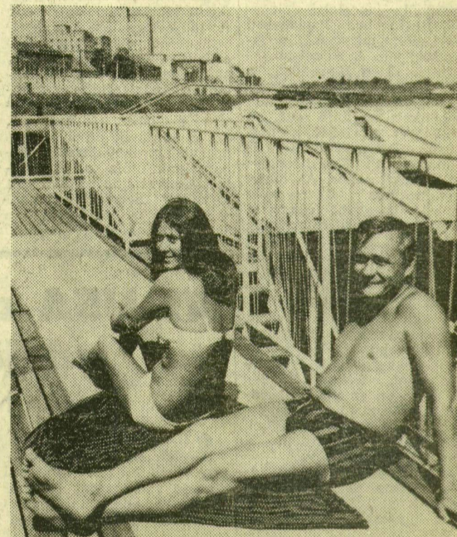
Mindenekelőtt napozásra szolgál, kellemes

Sokan egyszerűen csupán így nevezik az úszóházakat: deszka. Van ebben igazság, hiszen fenyőpallókkal borítottak azok vasszerkezetét. Kényelmes, a szegedieknek közeli strandolási lehetőséget nyújtanak a Tisza jobb partján veszteglő úszóházak. A napfürdő mellett azonban egyéb elfoglaltságot is találnak az ott pihenők.