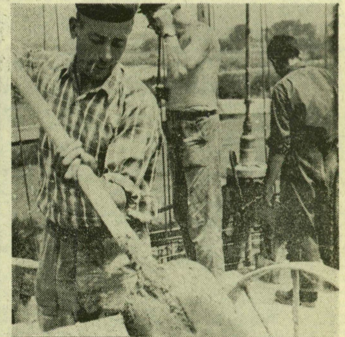
Minden méterhez 54 köbméter betont tömnek