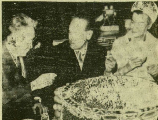
Cedenbal mongol miniszterelnök fogadta Fock Jenőt, a Minisztertanács elnökét és feleségét Ulánbátorban

Fock Jenő, az MSZMP Poli- tikai Bizottságának tagja, a Minisztertanács elnöke és felesége hétfőn hivatalos és baráti látogatásra megérke- zett a mongol főváros- ba. A magyar vendéget és kíséretét Ulánbátor rep- pülőtérén Jumzsagijn Ceden- bal, a Mongol Népi For- radalmi Párt Központi Bi- zottságának első titkára, a Mongol Minisztertanács el- nöke, valamint a mongol párt és kormány több más vezetője fogadta.