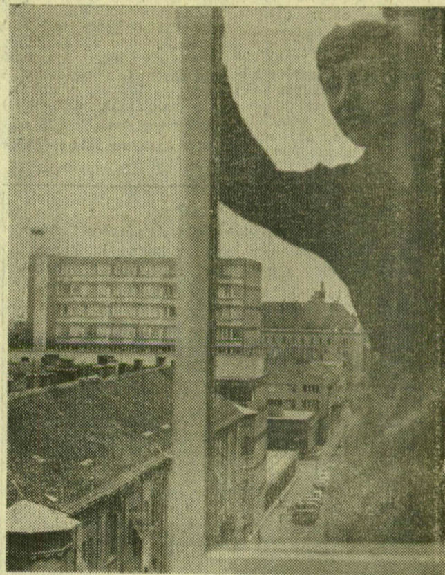
A hetedik szintről ilyen kilátás nyílik a Bajcsy-Zsilinszky utcára, az előde, a nyolcszintes Károlyi utcai lakóépületre