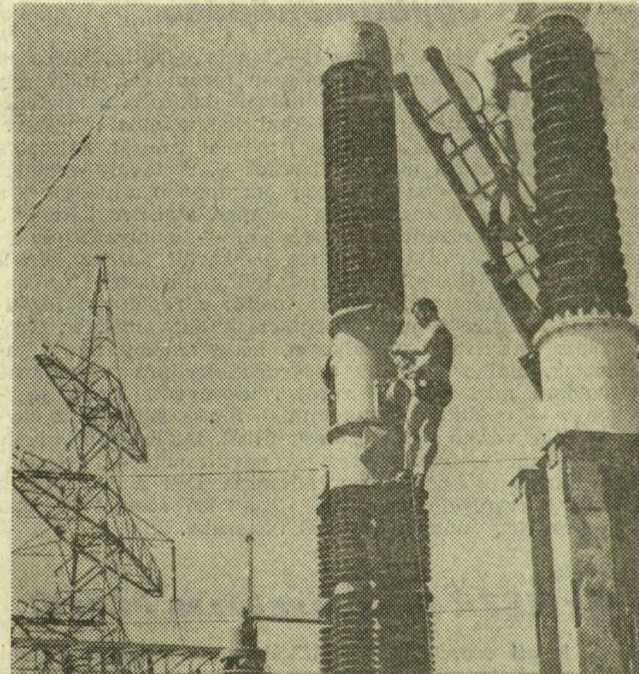
A csatlakozó berendezésen dolgoznak a szerelők

Befejezték a közelmúltban szállítási komplikációkkal érkezett két óriás trafó szerelését az Óthalmi út végén. Egyenkénti teljesítmőképességük 160 megavolt-ámpér. Egyik a román-magyar energiarendszer kapcsolatára épült, a másik pedig a hazai rendszeren belüli energiaszállítást segíti.