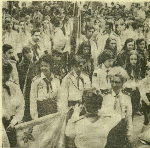
Kitüntetik a Dózsa György úttörőcsapatot

A szegedi gyermeknap leglátványosabb eseménye a Széchenyi téri nagyszabású úttörő-díszszemle volt. Ezen a város 25 úttörőcsapatának mintegy tízezer úttörője és kisdobosa vett részt. A vasárnapi gyermeknap eseményeiről lapunk 5. oldalán közlünk részletes tudósítást.