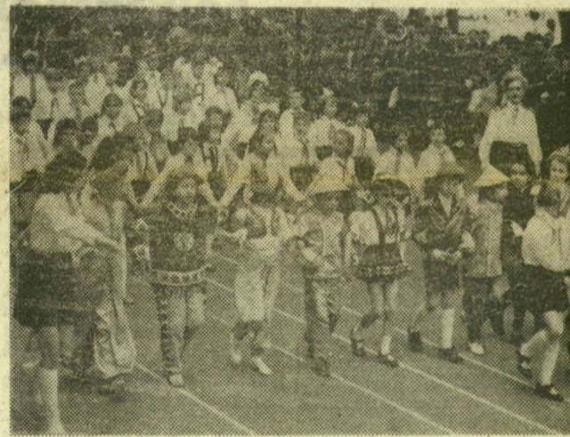
Jelmezes kisdobosok a Széchenyi téren