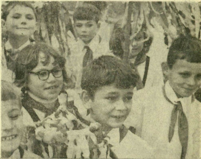
Kisdobosarcok az úttörőszemléről