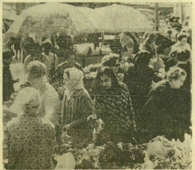
Kinek-kinek kedve szerint: rózsá- vagy hagymacsokrot