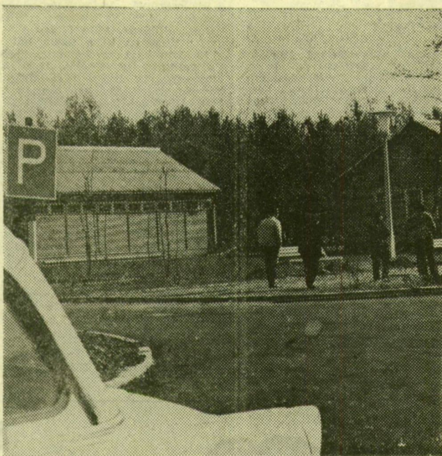
Ács S. Sándor felvétele

Hamarosan, ha minden jól megy, már május elején megnyílik az új, szegedi kemping. Képünk is azt bizonyítja, hogy már csupán az utolsó simítások vannak hátra. A két faház — a bal oldali a fürdő, jobbra pedig az egyik motelpület — mellől meg el kell takarítani a földkúpokat és be kell fejteni a parkosítást. Hogy ennél több munka van-e hátra, az majd a hamarosan sorra kerülő műszaki átadáson dől el.