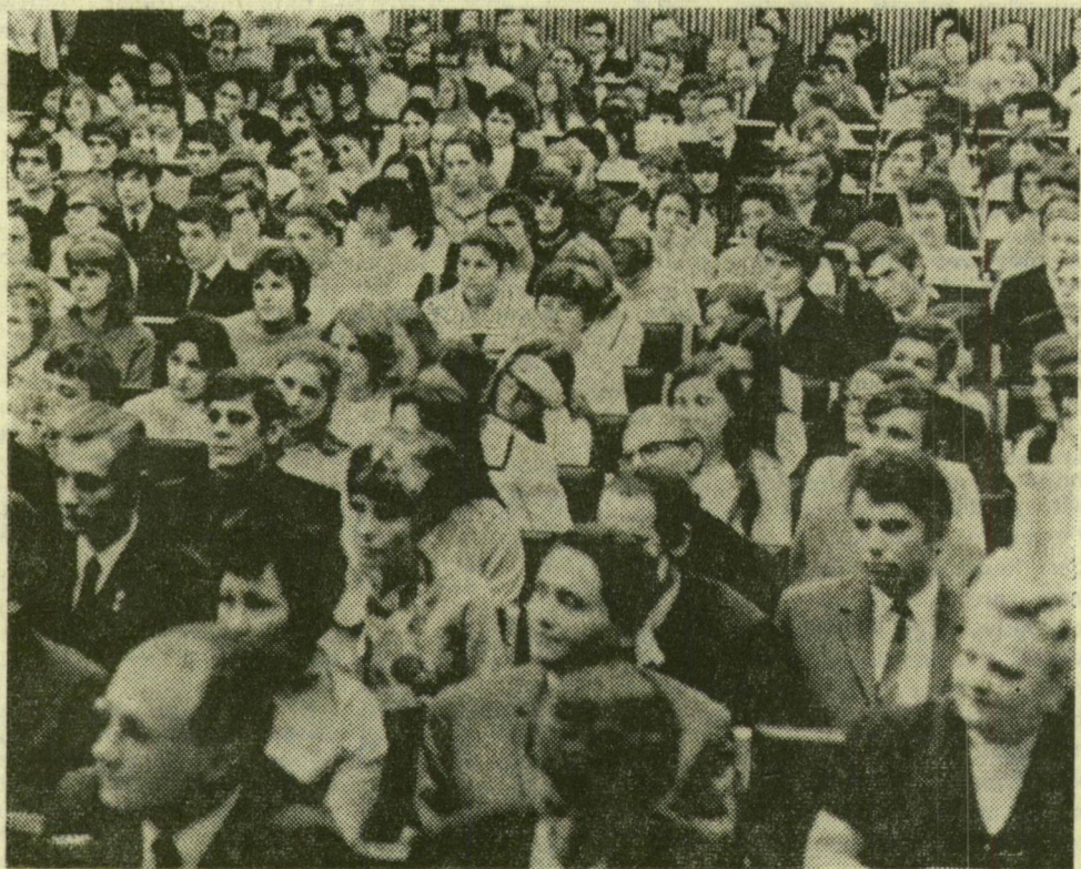
Az ifjúsági gyűlés résztvevőinek egy csoportja