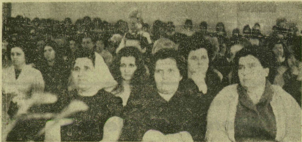
A gyűlés résztvevőinek egy csoportja

Az idei első magyar gazdasági napokat Hollandiában rendezik március 20 és 24 között. Ennek eseménysorozata Hollandia több nagyvárosára kiterjed. Az üzleti kapcsolatok elmélyítésére a magyar gazdasági napokhoz kapcsolódva a Medicor Művek Utrechtben a Stöpler-céggel együttműködve bemutatja legújabb orvosi műszereit és készülékeit. A MASPED Rotterdamban szintén képviselti magát a magyar gazdasági napokon, számolva azzal, hogy a rotterdami kikötő növekvő forgalma, Magyarország tranzitforgalmának egyre nagyobb jelentősége, továbbá a Rajna—Majna—Duna csatorna megépítésének perspektívái új lehetőségeket nyitnak a magyar és holland szállító vállalatok együttműködésére.