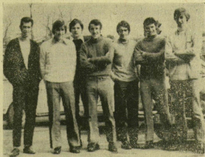
A Dózsa ellen ma kupamérkőzést vívó Celtic együttese tegnap már edzést tartott. Képünkön a csapat néhány tagja a Gellért Szálló előtt

A tavaszi labdarúgóidény első „hivatalos” nemzetközi eseménye lesz a Megyeri úti stadionban szerdán este 17.30 órai kezdettel sorra kerülő Ú. Dózsa—Celtic Glasgow BEK-mérkőzés. A két csapat közötti első találkozó iránt nagy érdeklődés nyilvánul meg, a kibocsátott 30 ezer jegy közül ugyanis több mint 20 ezer elővételben elkel. Kétségtelen, a hazai pálya előnye a lila-fehéreknek kedvez, ahhoz viszont, hogy a csapat előnyt tudjon szerezni a március 22-én, Glasgow-ban sorra kerülő visszavágóra, nagyon jó játékra lesz szükség — sokkal jobbra, mint amilyent szombaton nyújtottak az újpesztiek a Rába ETO ellen.