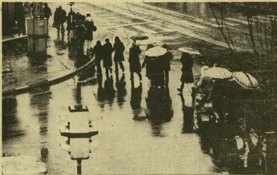
Eső áztatta tegnap a várost. Képközlök: szegedi utarcészet

A nagyobb folyók vizállását egyelőre nem befolyásolja az esőzés. Szegednél átmeneti emelkedés után ismét apadó tendenciát mutat a Tisza. A jelenleginél sokkal nagyobb mennyiségű csapadék lehülésánál is napok, sőt hetek szükségesek ahhoz, hogy a Tisza alsó szakaszának jelentősebben emelkedjen a szintje.