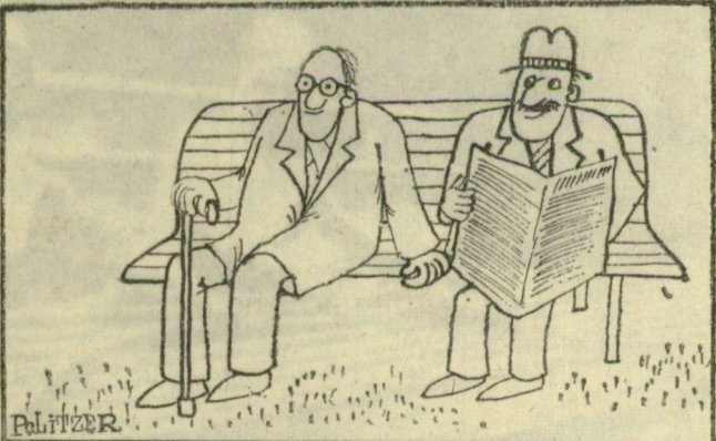
Az optimizmusnál csak gondtalan öregkor a szebb. Ezért mondja az egyik nyugdíjas a másiknak: seba, kifizetjük húsz év múlva az utolsó lakásrészt, s azután már be is rendezhetjük új otthonunkat