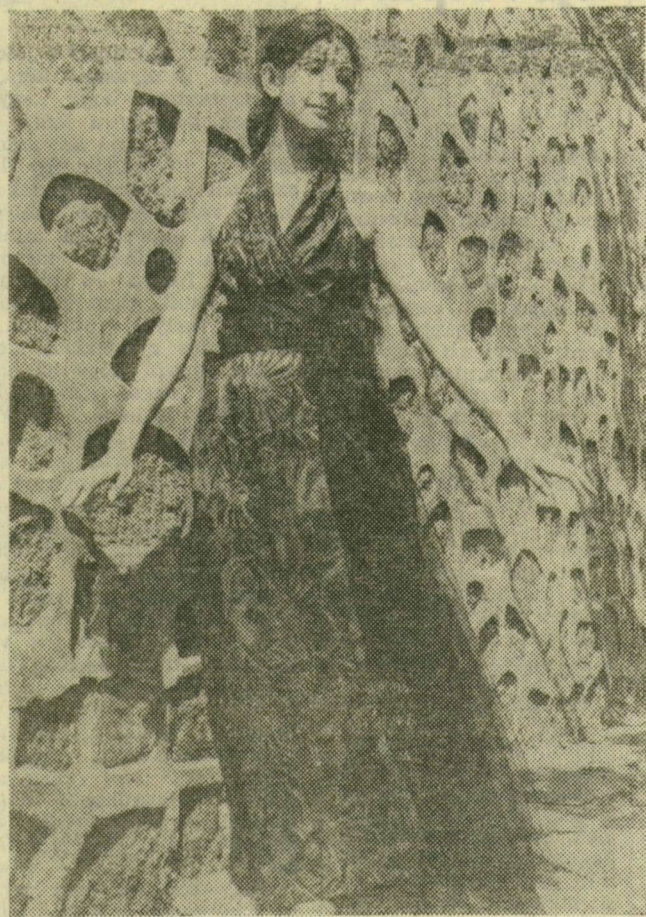
A plovdivi nők így öltözködnek. Természetesen nem az utcán, hanem a farsangi bálkon. Ez a hosszú, derék körül csavart fátollal ékesített estélyi ruha a bolgár divattervezők egyik idejű ötlete. A háttér nem tartozik a divatkritikához