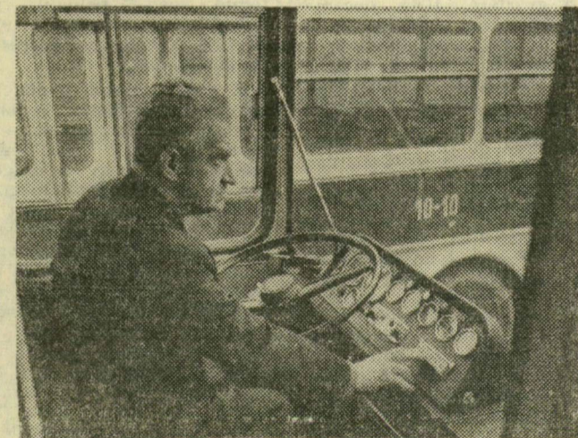
A gombnyomásra működő autóbussz állítólag nem vicc, hanem székesfővárosunk jövődö tömegközlekedési eszköze. Az Ikarus újfajta autóbuszán már meg is kezdtek a tanulást a BKV autóbusszvezetők. Ezek a járművek különleges kormányberendezéssel és gombnyomással működő sebességváltóval vannak felszerelve. Ezt a gombot a vezető kezeli, az utasok feltehetően továbbra is egymás gombját tépik