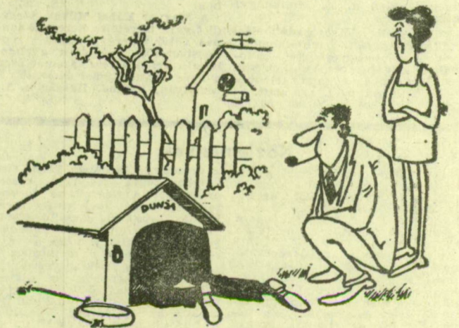
— Vajon megfelelően kezeli-e szegényt? — Azt nem tudom, de ő az egyetlen állatorvos, aki igazán házhoz megy...