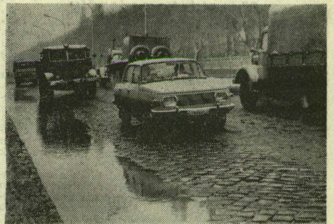
Beltenger a Kossuth Lajos sugárúton