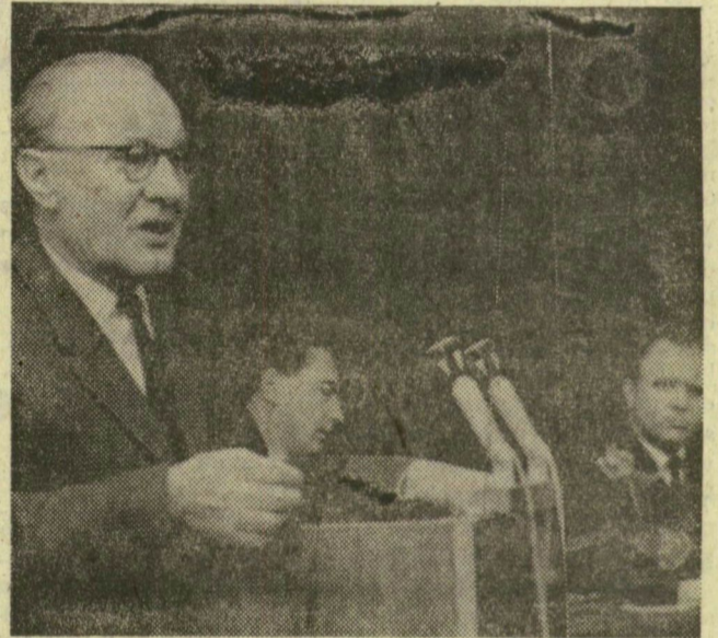
Kádár János felszólalása a vitában