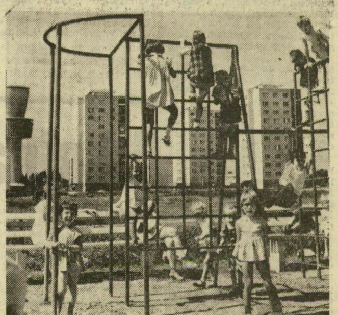
Öröm a földön és a magasban, mert ismét elkészült egy új játszótér