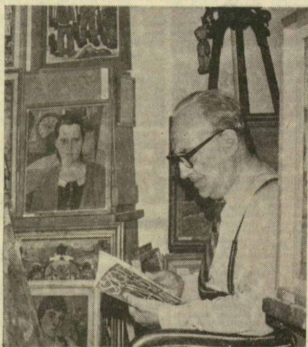
A művész műtermében

Ma, szombaton este ismét Farkas Ferenc népszerű daljátéka, a Csinom Palkó kerül a dóm előtti színpad közönsége elé. Képzünk: jelenet a második felvonásból