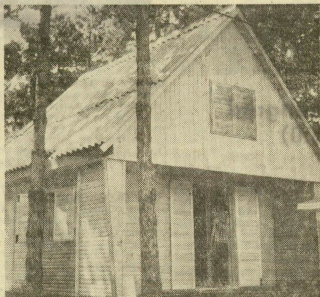
Takáros hétvégi ház

A József Attila Vadásztársaság (Dorozsma) fácánjai és a háztáji kisállatok, a postagalambok, valamint a csongrádi és kiskundorozsmai áfész nyulai teszik változatosá, érdekessé a széksóstói kiállítást. Kár, hogy a megnyitóra kevesen érkeztek.