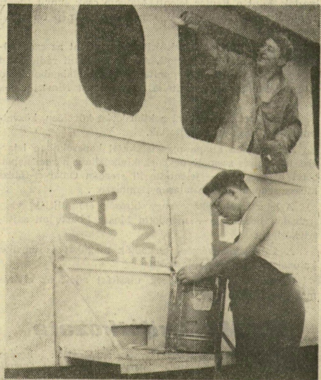
A nagyállomáson már festik az úttörővasút motorkocsiját jelképező makettet

Már a múlt héten is a megszokottnál jobban zajlott az élet az Ifjúsági Házban és a szegedi vállalatok KISZ-bizottságain. Most, a hét közepére pedig szinte „elszabadult a pokol”. Pillanatonként csörög a telefon a KISZ városi bizottságán és az Ifjúsági Ház igazgatójánál. Mindenki szervez, dolgozik a karneválért. Az üzemekben, gyárakban is dolgoznak a KISZ-tagok. Készítik a dekorációt, a szombaton teherautóra kerülő életképek kellekeit. A legtöbb helyen már a múlt hét óta nem pihennek a szerszámok munkaidő után sem. Akkor dolgoznak a fiatalok mesterművükön. Akkor és a múlt heti szabad szombaton, no meg vasárnap is. Mindenfelé készülnek tehát a karneválra, az ötödik ifjúsági napok szombati megnyitására.