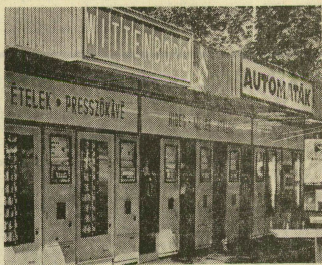
A Philips cég automata büféit szeptemberben állítják fel a Marx téren

sőrendű céljuk, hanem az autóbusszokat igénybe vevő közönség kiszolgálása, hogy ne legyen különbség a vonaton és a buszon utazó emberek kényelme között. Az 50-es számú Utasellató üzlet örömmel üdvözölte, hogy a városi tanács bezáratta az italmérséket a piactéren. Az Utasellató forgalmával így is elégedettek, hiszen ennek zömét az ételféleségek biztosítják.