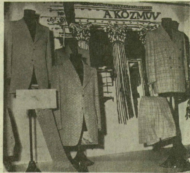
A Szegedi Ruhagyár hőrögztíteses zakóit, nadrágjait

— Napjainkban terjed el Magyarországon az igényes zenehallgatás divatja. Vállalatunk reagál az új igényre: jó minőségű erősítőket, akusztikai eszközöket, zenei átalakítókat készítünk. És hadd mondjam el, hogy olyan kisméretű hangszórókat, kényelmes fülhallgatókat is, amelyeket televízióhoz, rádióhoz, magnóhoz lehet csatlakoztatni — használatukkal például úgy figyelhető a műsor, hogy a környezetet nem zavarja a hangos zene, vagy beszéd.