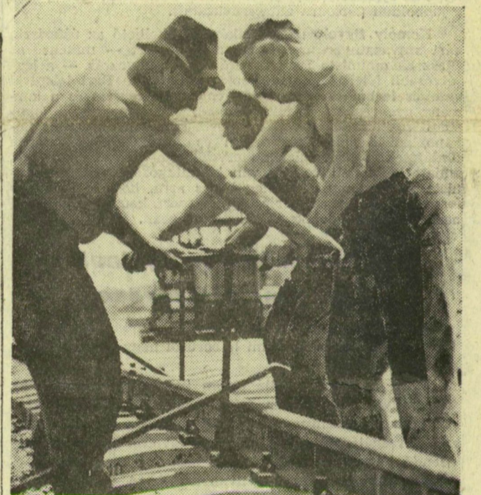
Két ember kapaszkodik egy-egy hatalmas csavarkulcs két ágába a sinek rögzítésénél a régi technológia szerint