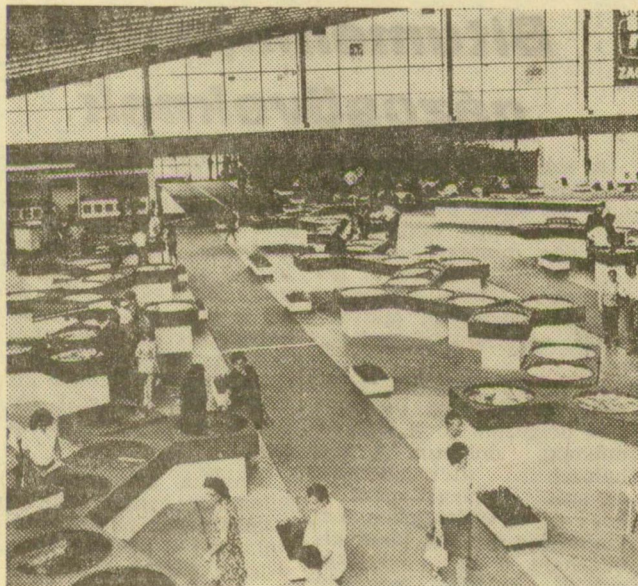
Kincsekkel telt vitrinek a szabadkai nagy vásárcsarnokban

Szabadkán az idén már másodszor rendezik meg a nemzetközi ékszer- és órákiállítását, melynek tavaly is óriási közönsége és sikere volt. A június 4-től 13-ig tartó kiállításon — a nagy vásárcsarnokban — 600 négyzetméter kiállítási területen helyezik el a jugoszláv, a svájci, az olasz és a nyugatnémet aranyművesek remekait. A mesés gazdagság bemutatón több mint 3 mázsa aranyat, ékszerrel mutatnak be, a tavalyinak kétszeresét.